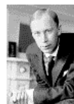
Sergueï Sergueïevitch PROKOFIEV