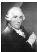
Franz Joseph HAYDN