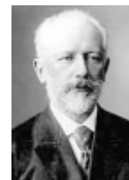
Piotr Ilitch TCHAIKOVSKI