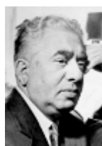
Aram Ilitch KHATCHATOURIAN